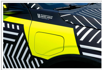
Prototyp des Renault Mégane E-Tech Electric.