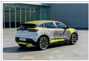
Prototyp des Renault Mégane E-Tech Electric.