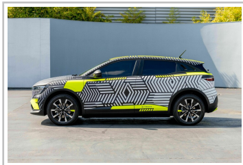
Prototyp des Renault Mégane E-Tech Electric.