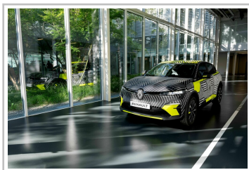
Prototyp des Renault Mégane E-Tech Electric.