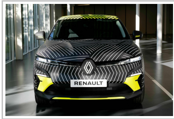
Prototyp des Renault Mégane E-Tech Electric.