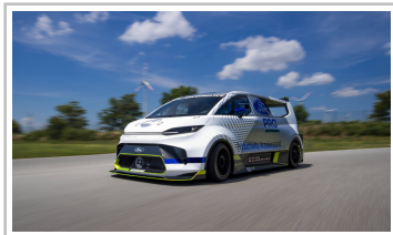
Ford Pro Electric Supervan.