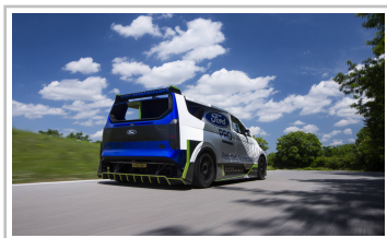
Ford Pro Electric Supervan.