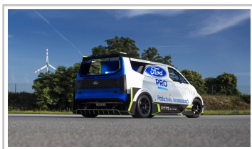
Ford Pro Electric Supervan.