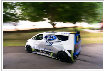
Ford Pro Electric Supervan.