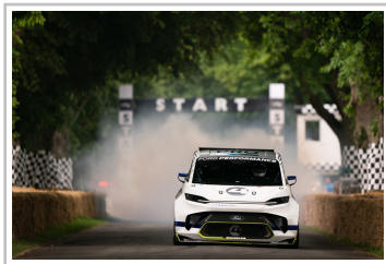
Ford Pro Electric Supervan.