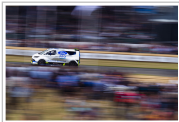
Ford Pro Electric Supervan.