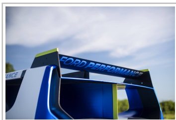
Ford Pro Electric Supervan.