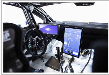
Ford Pro Electric Supervan.