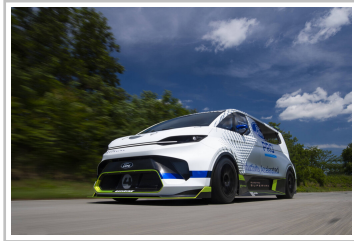
Ford Pro Electric Supervan.