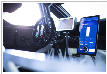
Ford Pro Electric Supervan.