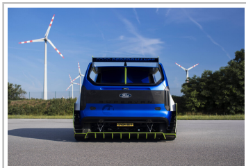
Ford Pro Electric Supervan.