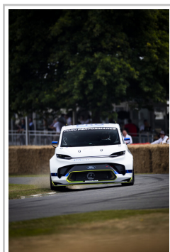
Ford Pro Electric Supervan.