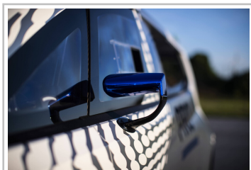
Ford Pro Electric Supervan.