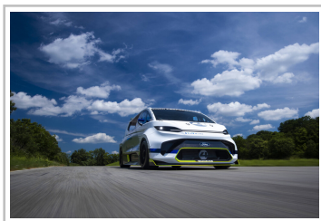
Ford Pro Electric Supervan.